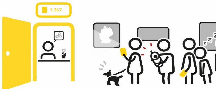
Abb. 1: OZG-Notwendigkeit (BMI 2022)

Was für die Einkäufe im täglichen Leben längst zur Selbstverständlichkeit geworden ist, mutet bei Behördengängen oft noch etwas befremdlich an. Einen neuen Personalausweis, eine Genehmigung zum Fällen eines Baumes im Garten oder das Kindergeld für den Nachwuchs zu beantragen, erfordert aktuell noch das analoge Beschaffen und das Ausfüllen von Formularen, Anlagen und Anfertigen von Kopien. Hat man alles vollständig zusammengestellt, ist schließlich die Einhaltung der korrekten Zustellung an die zuständige Stelle zu beachten. Oftmals zeigt sich, dass der persönliche Gang zur entsprechenden Behörde unumgänglich ist. Beispiele, die daran erinnern, dass Behördenkontakte dieser Art nicht mehr zeitgemäß sind, lassen sich schnell finden (siehe Abbildung 1). Dem wird nun zeitnah abgeholfen. Online-Dienste der Behörden des Bundes, der Länder und der Kommunen werden die Antragstellungen, behördeninternen Abläufe und die Erstellung der Bescheide bzw. Übersendung der Verwaltungsleistungen vollumfänglich und in automatisierter Form abbilden.